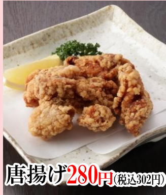
唐揚げ 280円 (税込302円)