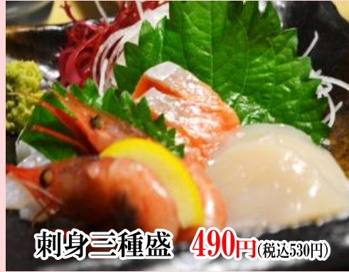
刺身三種盛 490円 (税込530円)