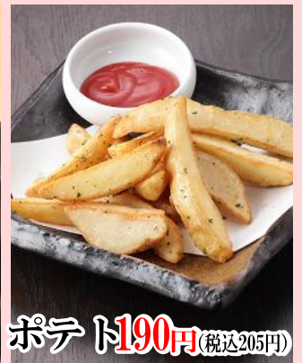
ポテト 190円 (税込205円)