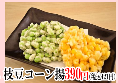
枝豆コーン揚げ 390円 (税込421円)