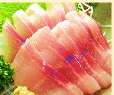
イワナ刺身 550円 (税込594円)