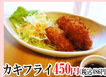
カキフライ 450円 (税込486円)