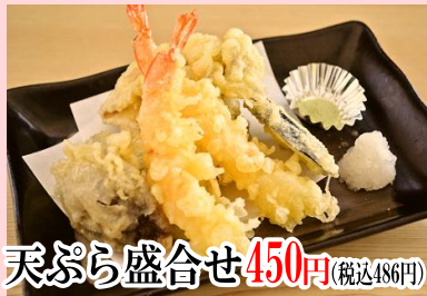
天ぷら盛合せ 450円 (税込486円)