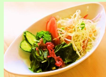
海藻野菜サラダ 490円 (税込529円)