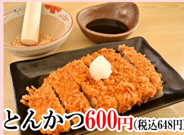
とんかつ 600円 (税込648円)