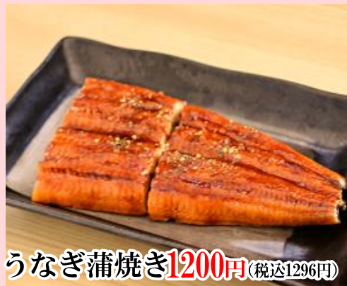
うなぎ蒲焼き 1200円 (税込1296円)