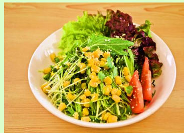
コーンサラダ 390円 (税込421円)