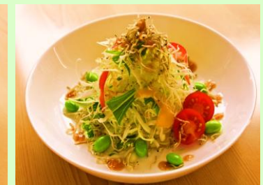
じゃこかり野菜 490円 (税込529円)