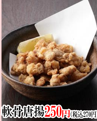
軟骨唐揚げ 250円 (税込270円)