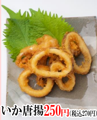
いか唐揚げ 250円 (税込270円)