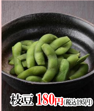
枝豆 180円 (税込195円)