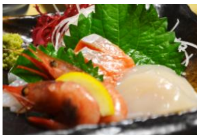
刺身三種盛 490 円(税込 530 円)