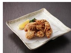
若鶏から揚げ 280 円(税込302円)