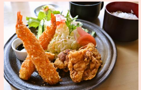
海老フライ&唐揚げ定食 980円(税込 1058 円)