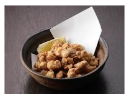
軟骨から揚げ 250 円(税込270円)