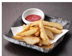
ポテト 190 円(税込205円)