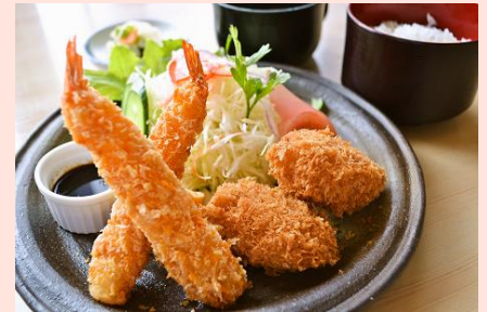
海老フライ&蟹コロッケ定食 980円(税込 1058 円)