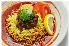
冷やし担々麺 825円(税込)

白金食堂 夏限定メニュー♪ 暑い日は、さっぱりとした冷やし麺がおすすすめ☆のどごしツルつと夏にぴったりの「夏野菜のおろしうどん・そば」・「冷やし中華」・「冷やし担々麺」が今年も登場！ぜひお召し上がりください！！