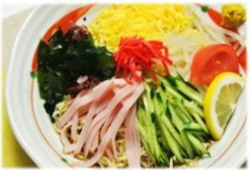
冷やし中華 880円(税込)