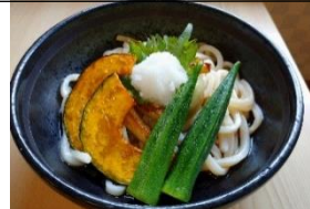
夏野菜のおろしうどん・そば 858円(税込)

土用の丑の日 今年の土用の丑の日は7月28日(水)です。今年もご予約受付いたします！詳しくは館内チラシ・HP・またはお気軽にお問い合わせください！