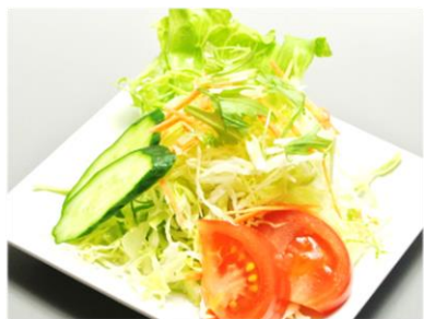
グリーンサラダ 290円(税込313)