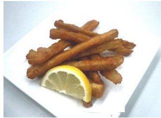
ごぼう唐揚げ 450円(税込486円)