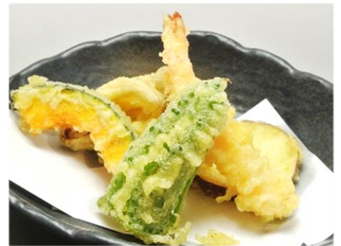
天ぷら盛合せ 530円(税込572円)