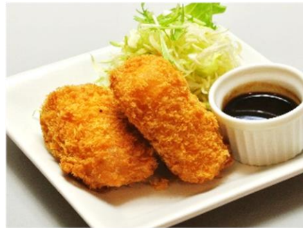
蟹クリームコロッケ 380円(税込410円)