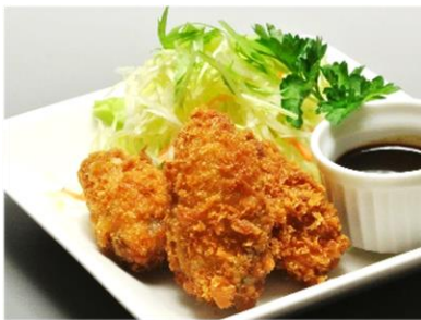
カキフライ 450円(税込486円)