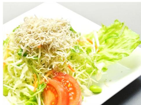
じゃこかり野菜 540円(税込583円)