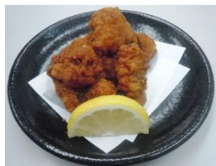
たこの唐揚げ 490円(税込529円)