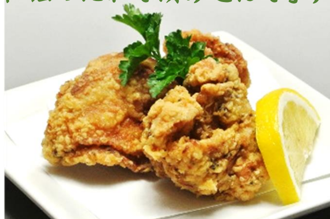
若鶏の唐揚げ 360円(税込389円)