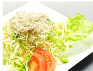
じゃこかり野菜 540円(税込583円)