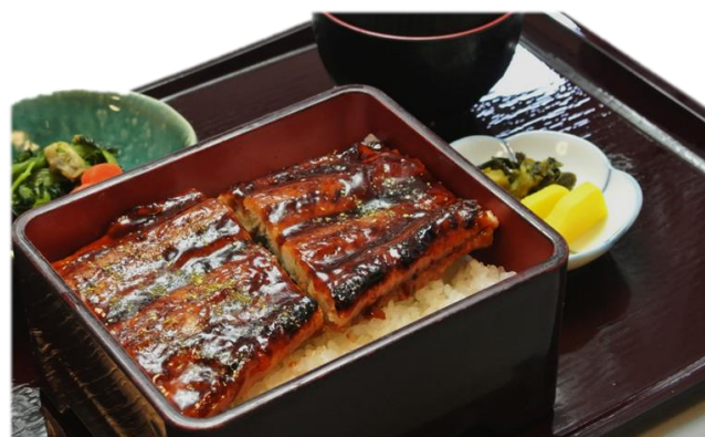
特選うな重 1,590円 (税込1,717円)