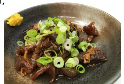
牛筋煮込み 600円(税込648円)