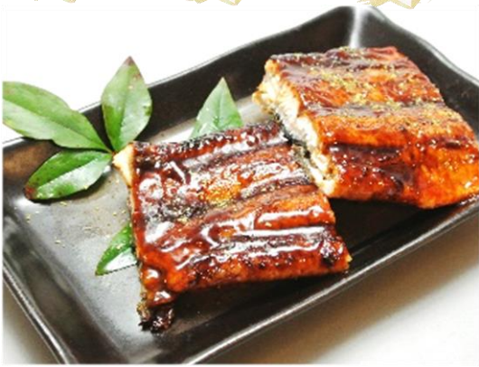
うなぎ蒲焼き 1,200円(税込1,296円)