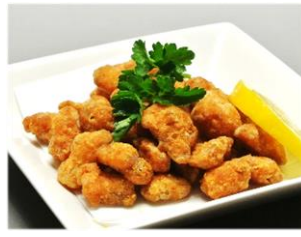
軟骨唐揚げ 330円(税込356円)