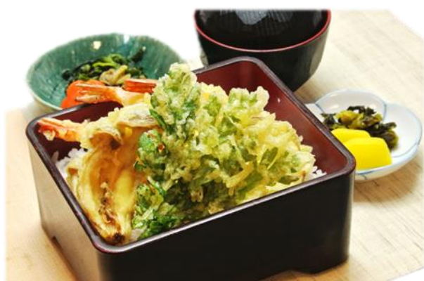
豪華天重 1,200円(税込1,296円)