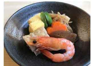
煮物盛合わせ 400円(税込432円)