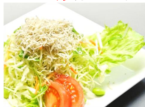
じゃこかり野菜 600円(税込648円)