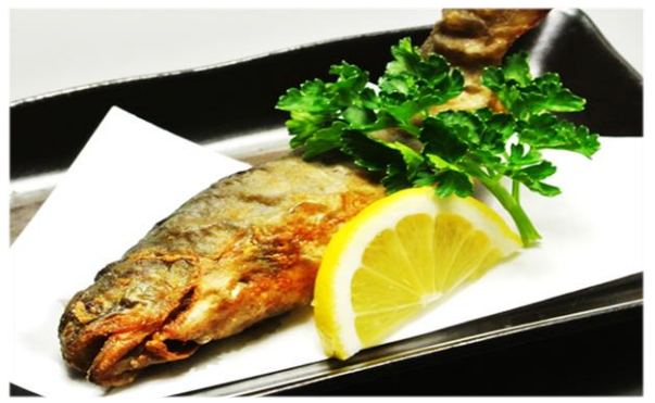
いわな唐揚げ いわな塩焼き 600円(税込648円)