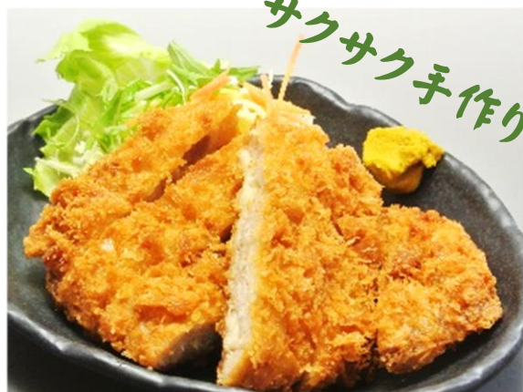
とんかつ 750円(税込810円)