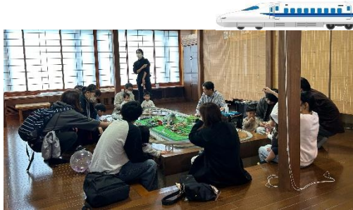
お子様に大人気！鉄道模型走行！